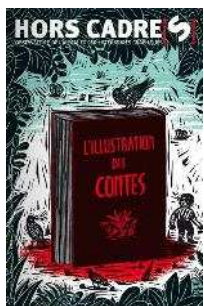
Hors cadres Núm. 9 (octubre 2011)

Manifiesto en defensa de la enseñanza pública contra los recortes en los presupuestos de educación La interacción y la ética de los pequeños (II) El espacio exterior: un espacio lleno de posibilidades El balanceo Tertulias dialógicas: una manera de aprender juntos El aprovechamiento educativo del medio, privilegio para los Centros Rurales Agrupados La relación con las familias Interacción temprana en el desarrollo afectivo y de la comunicación