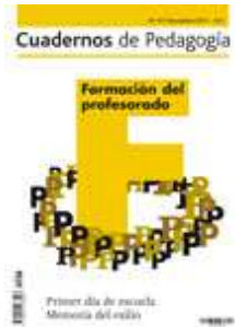
Cuadernos de pedagogía Núm. 417 (novembre 2011)