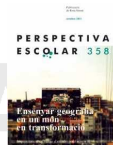
Perspectiva escolar Núm. 358 (octubre 2011)

Monogràfic: Ensenyar geografia en un món en transformació