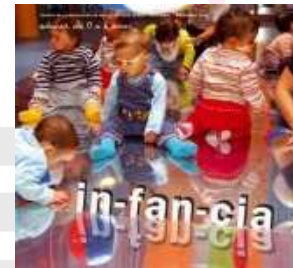
Infancia: educar de 0 a 6 años Núm. 130 (novembre/desembre 2011)

Manifiesto en defensa de la enseñanza pública contra los recortes en los presupuestos de educación La interacción y la ética de los pequeños (II) El espacio exterior: un espacio lleno de posibilidades El balanceo Tertulias dialógicas: una manera de aprender juntos El aprovechamiento educativo del medio, privilegio para los Centros Rurales Agrupados La relación con las familias Interacción temprana en el desarrollo afectivo y de la comunicación