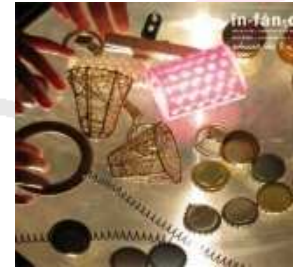
Infancia: educar de 0 a 6 anys Núm. 183 (novembre/desembre 2011)

Monogràfic: Formación del profesorado Coordinat per Encarna Soto Gómez