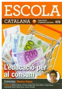
Escola catalana Núm. 472 (setembre/octubre 2011)

Educació violència i drets de l'infant Començant a caminar...com a mestra La complexitat de la pràctica pedagògica i el criteri del pedagog Família i escola comparteixen Un niu d'ocells Experimenten o exploren els infants de zero a tres anys? Conversa amb Thomas Armstrong Els petits tresors de cada dia Primer penso i després començo a construir Resiliència i escola bressol