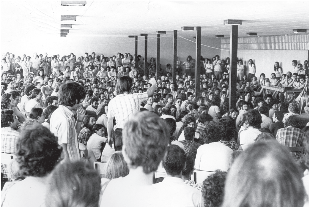
Tema General 1975. Debat final sobre el document Per una nova escola pública. Porxo del Centre Fonoaudiològic de Montjuïc

pedagògics». Mostrant com els clàssics ho són, justament, perquè ens continuen parlant de problemes d'actualitat. A favor de l'escola pública foren invocats Plató, Calassanç, Comenius, Reixac, Rousseau, Condorcet, Fröbel, Dewey, Freinet, Sensat, Galí, Freire i vint-i-dues veus més, que assenyalen el procés de somnis i de tensions vers la consecució de l'escola pública. 10