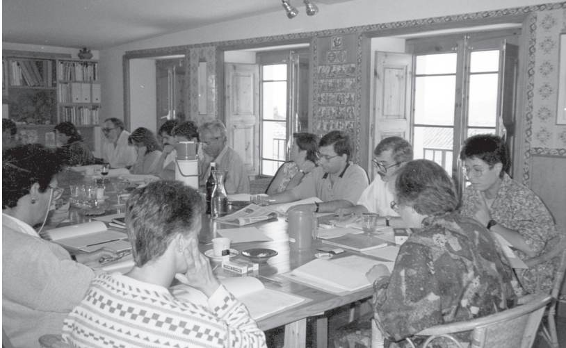
Consell de la Fundació Àngels Garriga de Mata

El maig de 2004, en ser anomenada presidenta del Consejo Escolar del Estado, compaginà la feina de la Fundació amb la del càrrec del Consejo, va viure entre Madrid i Saifores.