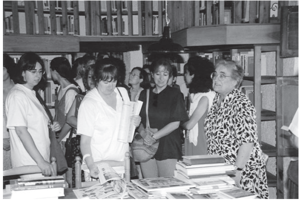
Biblioteca de la Fundació Àngels Garriga (Saifores)

Marta Mata es considerava afortunada d'haver pogut col·laborat en l'aprovació de la LODE, «l'única llei que conec que es dedica a garantir el dret a l'educació», i la LOGSE. «Maravall –continuava–, ha deixat en la història de l'educació d'Espanya les dues fites jurídiques més importants: la LODE i la LOGSE.» 8