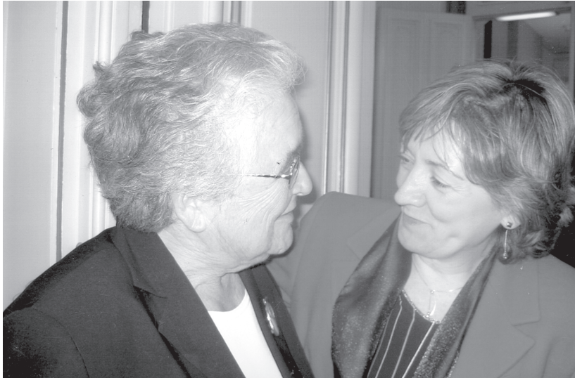
Amb la ministra M. Jesús San Segundo en la presa de possessió com a presidenta del Consejo Escolar de Estado (2004)

merescuda, la ministra M. Jesús San Segundo li va oferir l'oportunitat de dirigir-lo, no s'ho va pensar dues vegades. Amb la seva carrera professional i política culminada, però amb els ideals intactes, i amb les energies que li conferien la seva fe en les persones i el seu amor als nens i als joves, va acceptar el repte i es va proposar convertir el Consejo en un organisme més viu, menys burocràtic, més proper als problemes que es plantegen cada dia a l'escola, més present en la societat i que, en la seva composició i en els seus documents, reflectís la transformació del nostre Estat en un Estat autonòmic. Aquesta nota precipitada, escrita quan la seva memòria és encara viva entre nosaltres, pretén donar un senzill testimoniatge dels seus esforços i dels seus assoliments i retre tribut, també, a la seva manera de dirigir el Consejo .