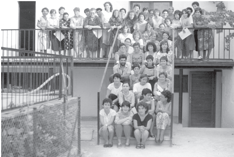
Mestres a les escales de Saifores. 1986

«Vull en aquest punt de brots múltiples d'escoles d'estiu, finals de la dècada de 1970, recordar la il·lusió que et va fer quan uns quants mestres, homes i dones del Penedès, et plantejaren de fer l'Escola d'Estiu del Penedès, i del Garraf no ho oblidem, a Saifores. Recordo que estava en el raconet de Rosa Sensat on compaginàvem el "Maidada Exprés", un full del diari Tele-Exprés dedicat a infants, i em vas cridar per recordar-me que tot i que seria una escola petita, li havíem