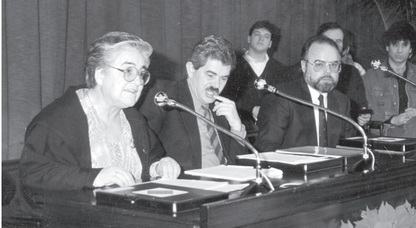
Acte de constitució del Consell Escolar Municipal i dels consells escolars de districte (1990)