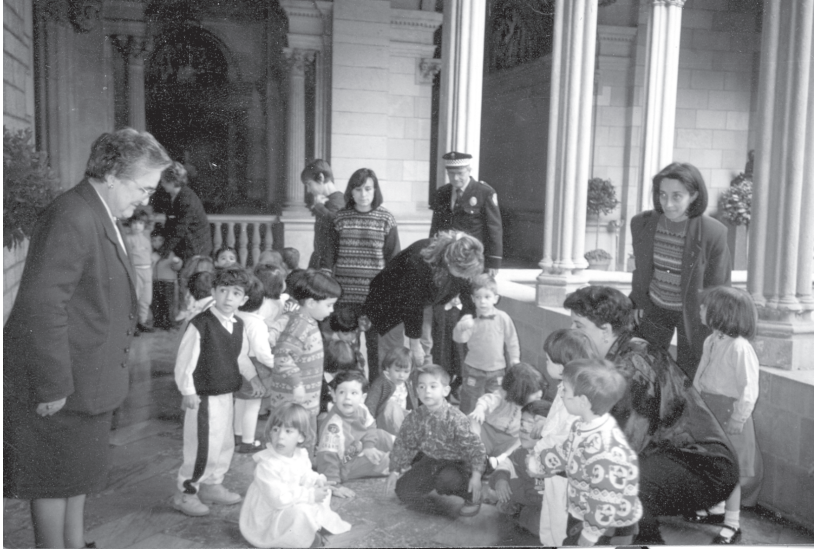
Infants d'escola bressol a l'Ajuntament de Barcelona