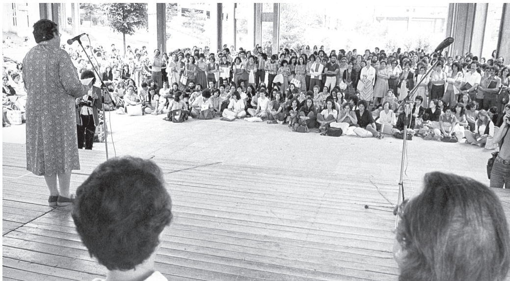
Escola d'Estiu 1979. Bellaterra

El mateix any 2002, el Fòrum Barcelona 2004 li va demanar l'impuls de la participació de les escoles a l'esdeveniment i ho va acceptar. Va idear com havia de ser aquesta participació i la va coordinar. Una vegada més, vaig tenir la sort d'ajudar-la. Hi van participar gairebé mil centres educatius de Catalunya. En un moment determinat, en què va veure que no podia dedicar-se a la Fundació com volia, em va dir: «A partir d'ara, no em deixis dir que sí de res més.» Vaig tenir molt clar que, arribada l'ocasió, no em faria cap mena de cas.