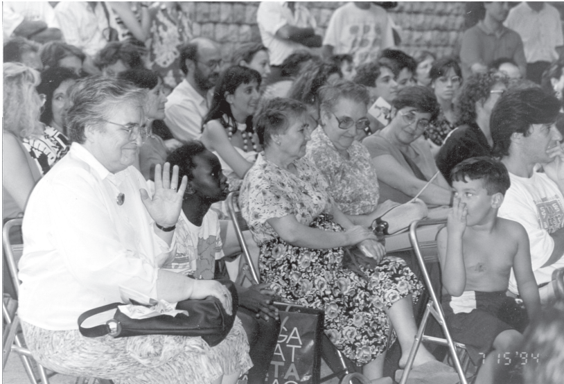
Complicitat al barri del Raval

comportava una participació en un projecte d'escola i una escola oberta als pares i a la societat en general. El fet de sentir-se formar part d'un determinat col·lectiu començava per la formació dels equips de mestres, es reflectia en un procés de consolidació del grup classe, en la solidaritat entre els alumnes d'una mateixa escola, seguia en un pla de col·laboració efectiva amb els pares i mares, amb altres escoles, i es volia una institució oberta al barri, integrada al poble o ciutat, al país i al món.