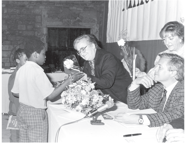
Jocs Florals Infantils de Ciutat Vella, 30 de maig de 1990

formació permanent es feia en horari lectiu. D'altra banda, els equips d'assessorament psico-pedagògic es varen integrar a les dinàmiques generals de cada centre i facilitaren la tasca, tant del tractament de la diversitat a les aules com l'adaptació de les noves normatives d'educació. Entre les prioritats del Pla de formació, estretament relacionada amb la concepció de Ciutat Educadora s'impulsaren el que en dèiem «programes prioritaris». Aquests programes eren: educació musical, educació plàstica, educació física, educació en els nous mitjans de comunicació i educació en l'informàtica. Aspectes formatius que calia potenciar. La Marta ho deia així: