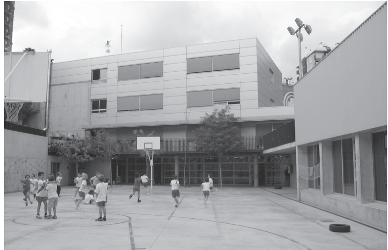
Escola Orlandai (Barcelona)

que no existeixi a la realitat, si és que prenen el compromís de la seva realització». 12