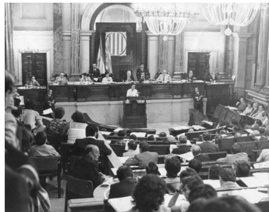
Parlament de Catalunya