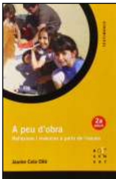
CELA, Jaume. A peu d'obra: reflexions i vivències a partir de l'escola