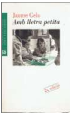
CELA, Jaume. Amb lletra petita